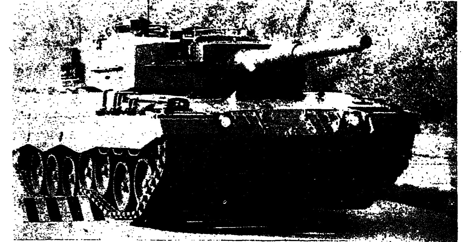
مبارة طوبير، الألمانية